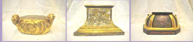
Piccolo Crocifisso di Carlo Giuseppe Giorgioli. Capitelli, legni della bottega di Roggio (XVI/XVII)