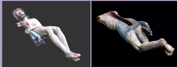
Grande Crocefisso di San Silvestro Prima del restauro