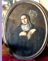
Santa Chiara di Montefalco (Anonimo, fine XVII)