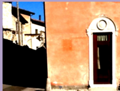
Apertura Sala San Giorgio, vestimenta liturgiche